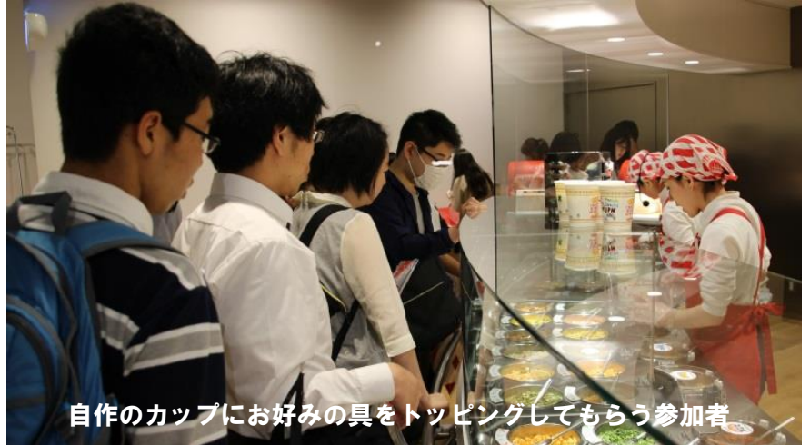
自作のカップにお好みの具をトッピングしてもらう参加者

参加者全員が挑戦しました。配布されたカップにさまざまな色のマジックペンを用いて、それぞれが知恵を絞りながら仕上げました。次のコーナーでは出来上がったカップに、ヌード