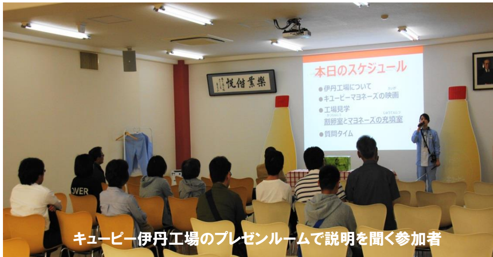
キューピー伊丹工場のプレゼンルームで説明を聞く参加者

次に向かったのは「木下大サーカス」が興行中の鶴見緑地公園でした。公園内の木陰でお弁当を食べ、い