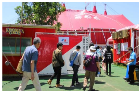
サーカス会場に入場する参加者

特にライオンやゾウ、シマウマにキリン等動物による見事な演技に、参加者は拍手喝采の連続でした。